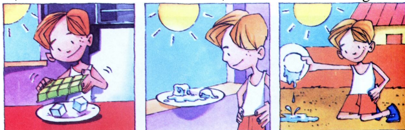
Figura 2: Imagem do livro da segunda série, coleção C, exemplificando a unidade temática “Estados físicos”.

A unidade temática “Estados físicos” configura-se como mais um exemplo da redução das questões e conhecimentos relacionados à água. Nesse exemplo, assim como ocorre em outros casos nos livros, os conhecimentos não se restringem apenas ao contexto local, mas sim ao contexto doméstico, conforme ilustra a Figura 2.