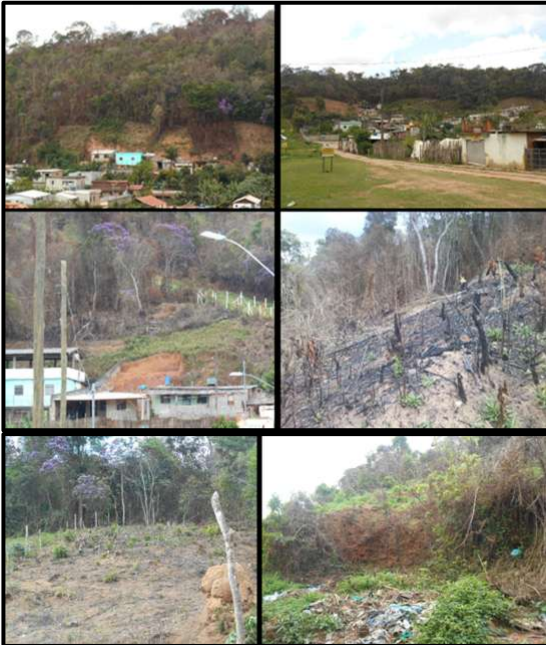
Figura 2- Ocupação desordenada, desmatamento, incêndios florestais e lixo nos limites da Reserva Biológica de Pinheiro Grosso.

fogões a lenha; despejos de resíduos sólidos nas áreas da UC e também nas margens do córrego que atravessa a comunidade; soltura de animais domésticos para pastoreio nas áreas de ReBio; incêndio florestais causados pelo uso do fogo para limpeza de terrenos e lotes, que fogem ao controle e alcançam áreas da UC, e esgoto a céu aberto, como podem observados na figura-2, corroborando assim, com estudo realizado por Silveira Junior et al (2013).